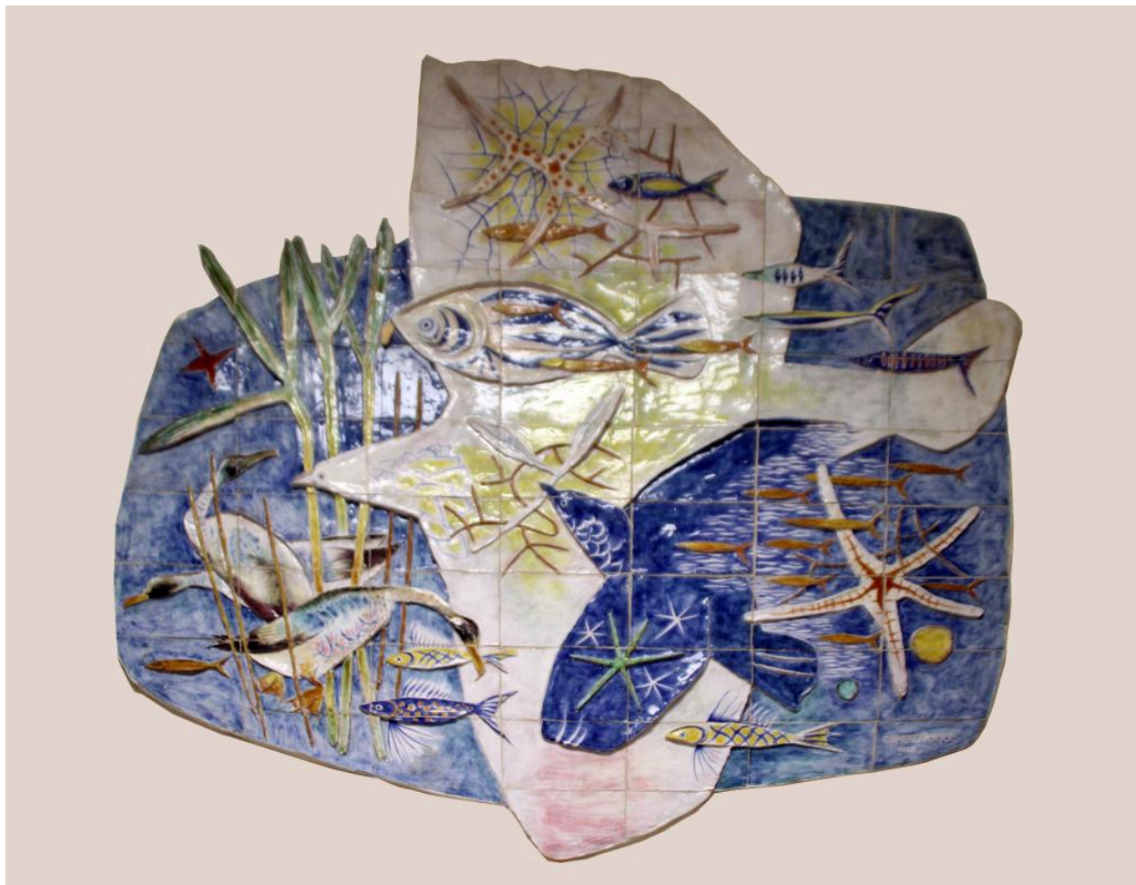
Décor en céramique de Jean Camberoque.